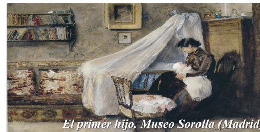
El primer hijo. Museo Sorolla (Madrid)

El sentido cristiano de la vida ha influido para que en nuestra sociedad se promueva cada vez más: una conciencia más viva de la libertad y responsabilidad personales en el seno de las familias; el deseo de que las relaciones entre los esposos y de los padres con los hijos sean virtuosas; una gran preocupación por la dignidad de la mujer; una actitud más atenta a la paternidad y maternidad responsables; un mayor cuidado a la educación de los hijos; una mayor preocupación de las familias para relacionarse y ayudarse entre sí.