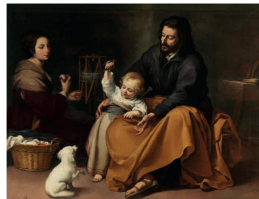
La Sagrada Familia del pajarito Museo Nacional del Prado (Madrid)

La familia es un don tan precioso porque forma parte del plan de Dios para que todas las personas puedan nacer y desarrollarse en una comunidad de amor, ser buenos hijos de Dios en este mundo y participar en la vida futura del Reino de los Cielos: Dios ha querido que los hombres, formando la familia, colaboren con Él en esa tarea.